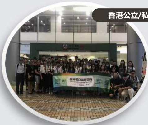
香港公立/私立医院参观