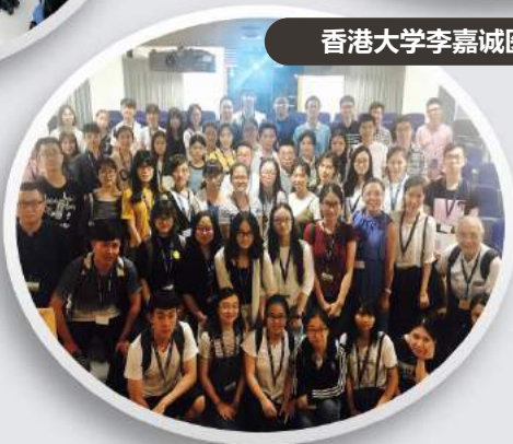
香港大学李嘉诚医学院参观