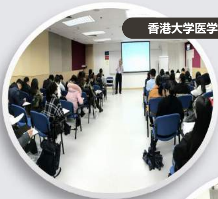
香港大学医学讲座